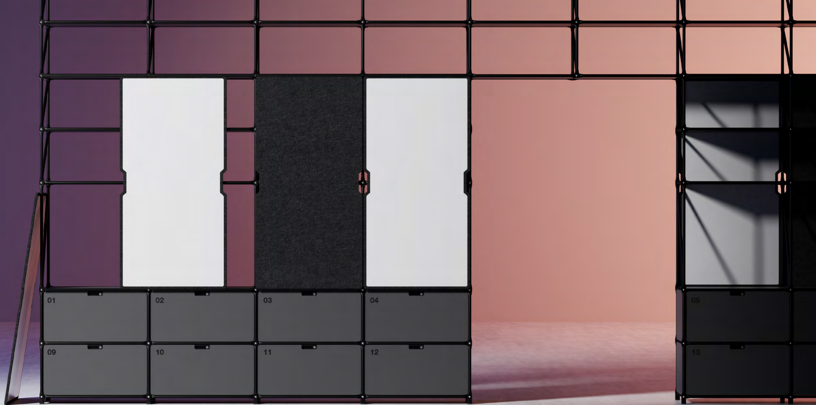
FlexBoard Pro L an einem unserer Raumteiler mit Schließfachsystem.