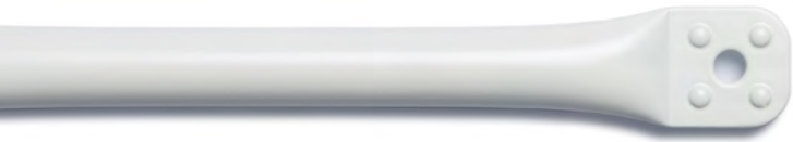
WhiteLine Stahlrohr weiß pulverbeschichtet. RAL*: 9010, glatt, matt.