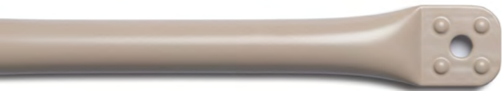
SandLine Stahlrohr sandgrau pulverbeschichtet. RAL*: 7044, glatt, matt.