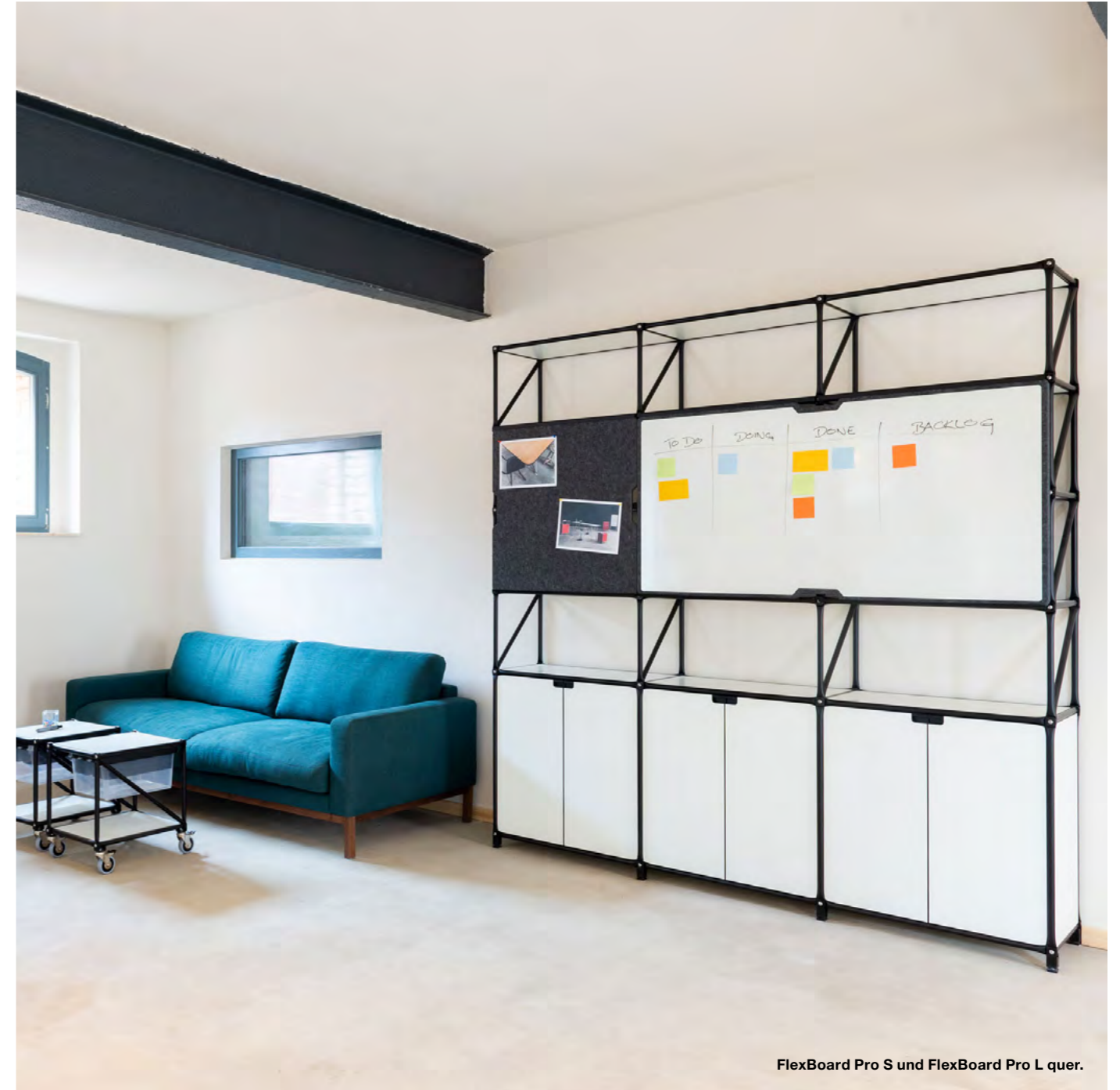
FlexBoard Pro S und FlexBoard Pro L quer.

B: 72 cm Wandmontierte Aufbewahrung für bis zu 4 FlexBoard Pro · optional in BlackLine