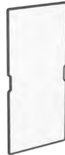
FlexBoard Pro L #70597

B/H: 72/108 cm Leichtes, magnetisches White- und Pinboard bestehend aus einem Faserplattenkern aus Vlies.