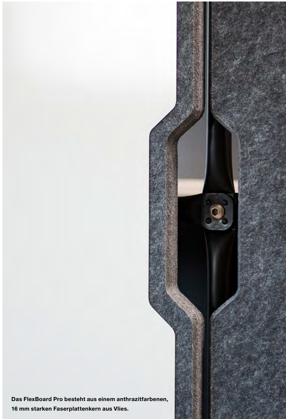
Das FlexBoard Pro besteht aus einem anthrazitfarbenen, 16 mm starken Faserplattenkern aus Vlies.