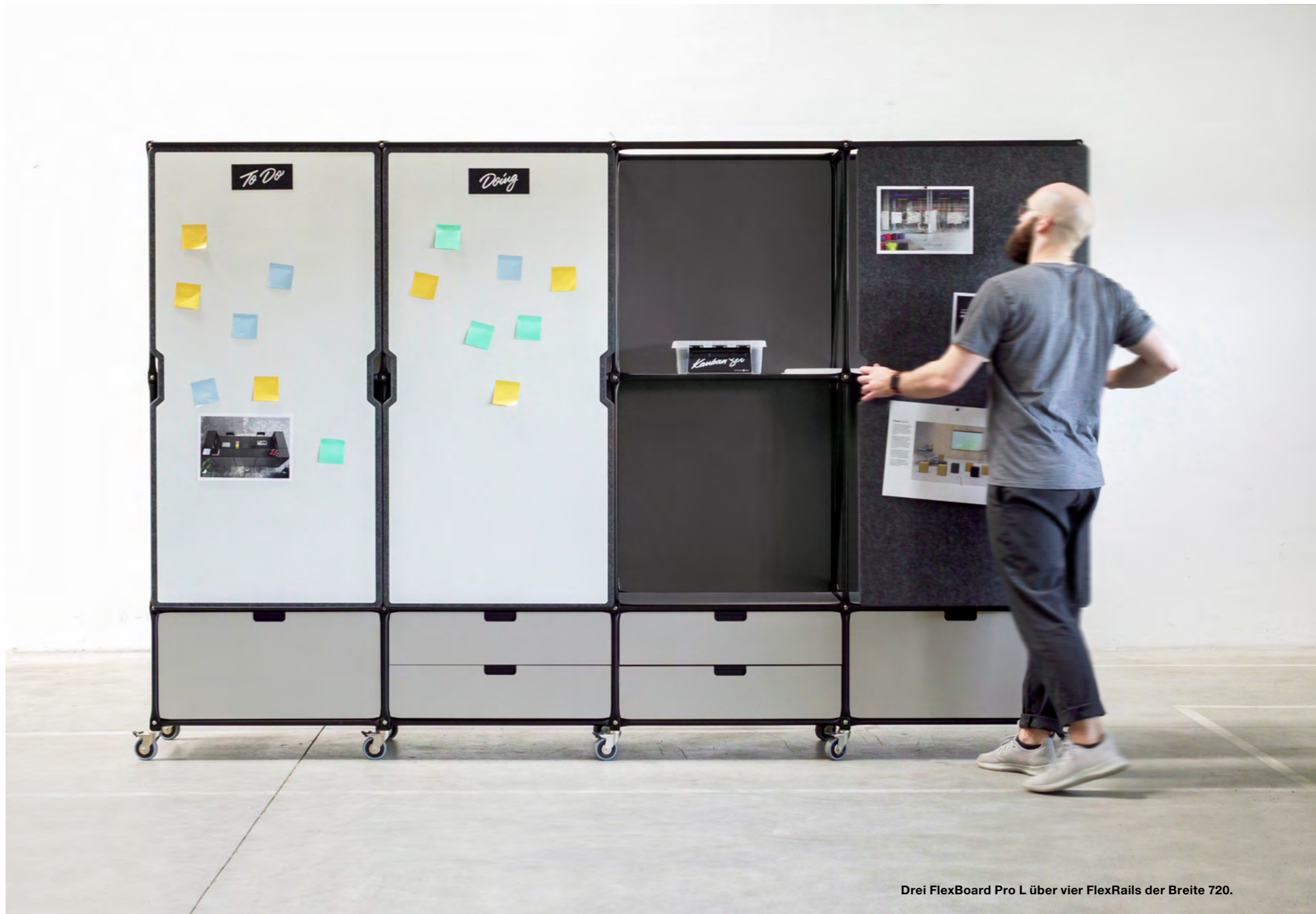
Drei FlexBoard Pro L über vier FlexRails der Breite 720.