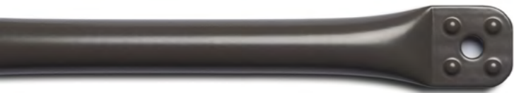
GraphiteLine Stahlrohr graphit pulverbeschichtet. RAL*: 7039, glatt, matt.