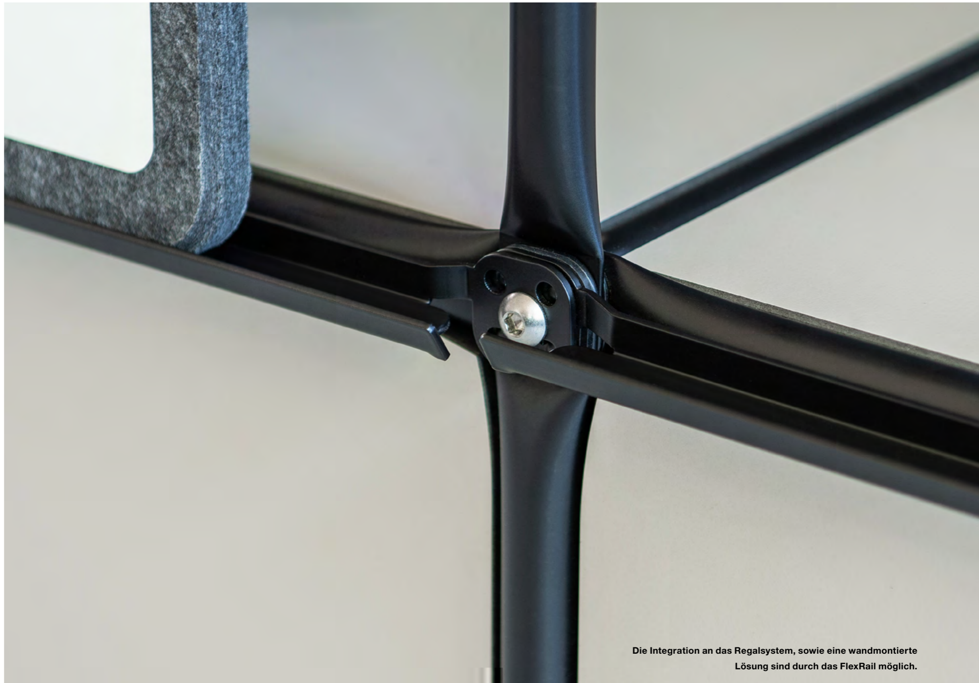
Die Integration an das Regalsystem, sowie eine wandmontierte Lösung sind durch das FlexRail möglich.