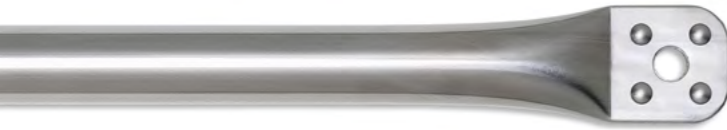
SteelLine Edelstahl gebürstet

Die Oberflächen der Edelstahlkomponenten können Sie im Oberflächenfinish Edelstahl, gebürstet (SteelLine) oder Stahl pulverbeschichtet in den zeitlosen Farben weiß (WhiteLine), sandgrau (SandLine), graphit (GraphiteLine) und schwarz (BlackLine) oder den bunten Farben (ColourLine) wählen.