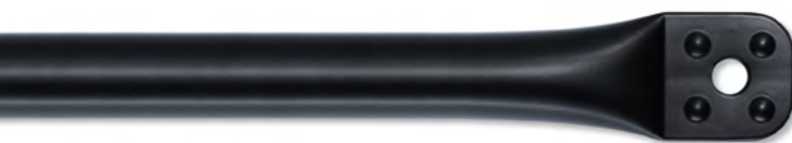
BlackLine Stahlrohr schwarz pulverbeschichtet. RAL*: 9005, glatt, matt.