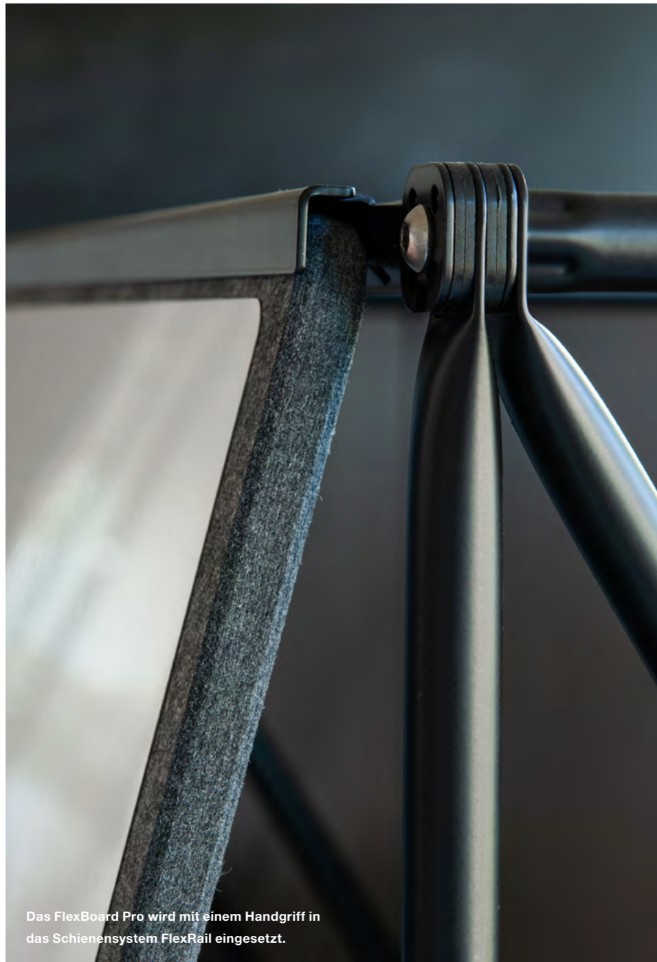
Das FlexBoard Pro wird mit einem Handgriff in das Schienensystem FlexRail eingesetzt.