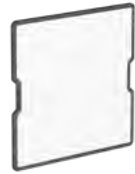
FlexBoard Pro S #69304

Seite, besteht aus einem anthrazitfarbenen Faserplattenkern aus Vlies. Die Integration an das Regalsystem, sowie eine wandmontierte Lösung sind durch das FlexRail möglich. Die Wandaufbewahrung dient der Lagerung von bis zu vier FlexBoard Pro.