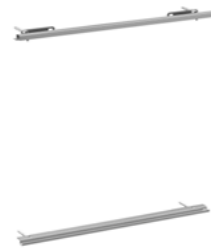
WallRail Pro 2.0 - Grundmodul S/M #78861

Schienenprofil-Set für die Aufnahme und Nutzung des FlexBoard Pro an System 180 Möbeln. Verfügbar in den Breiten 360 (# 70769), 450 (#70759), 540 (#70749), 630 (#70739), 720 (#70590), 810(#70719), 900 (#70729). · optional in BlackLine