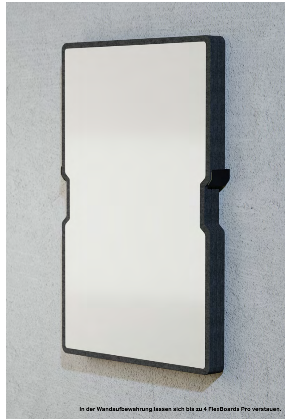
In der Wandaufbewahrung lassen sich bis zu 4 FlexBoards Pro verstauen.